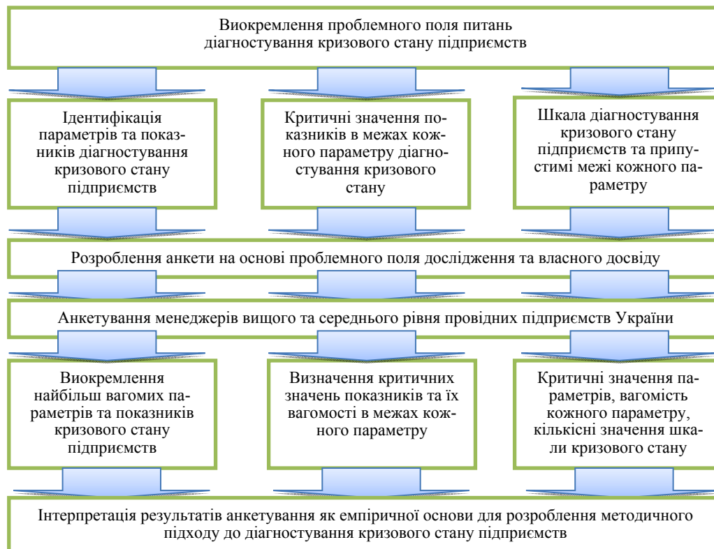
Рис. 2. Алгоритм дій для діагностування кризового стану підприємств

В авторському розумінні, діагностика кризового стану — це процес оцінки параметрів, які відображають «економічне здоров'я бізнесу», з подальшим порівнянням їх з критичними інтервальними значеннями, що сигналізують про наявність кризи в ІТ-компаніях. Для обґрунтування параметрів, що характеризують «економічне здоров'я ІТ-бізнесу», автором було використано метод анкетування. Це було зроблено з метою забезпечення максимальної об'єктивності у виборі ключових параметрів, а також для оптимізації їх кількості, що сприяє зручності та простоті практичного використання розробленої методики (рис. 2).